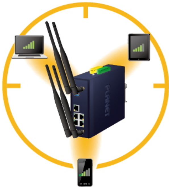
Dedicated and stable signals