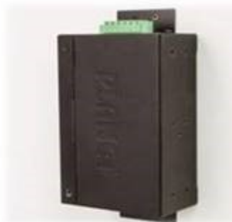
Wall mounting (Space saving)